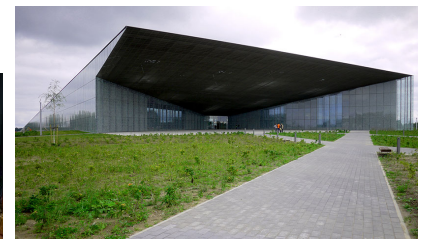
Estonia National Museum