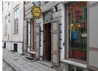
Estonia handcraft house