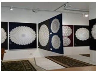
Ace of Lace Gallery