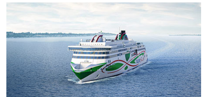
タリンクシリヤライン