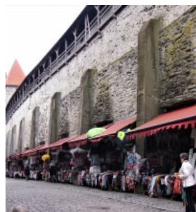
タリン セターの壁