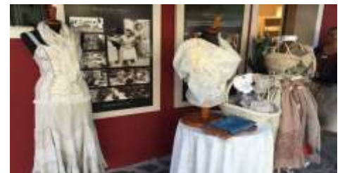
ブラーノ島のレース編みのお土産屋