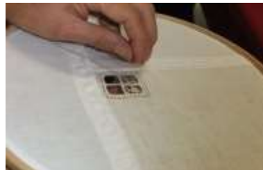
Abilmenteでのワークショップ

年に2回開催される創作ホビー展。 創作的手芸の展覧会の秋版は10/17-10/20まで大勢の愛好家の為にイタリアで開催される注目のショーです。伝統と新しい創造的な趣味に関するヒントが得られるでしょう。