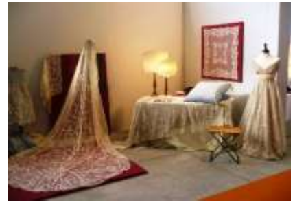
チュールレース博物館