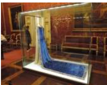
ピッティ宮殿の衣装博物館