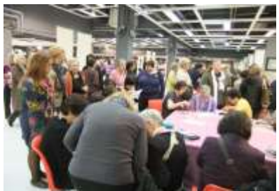
Abilmenteでのワークショップ