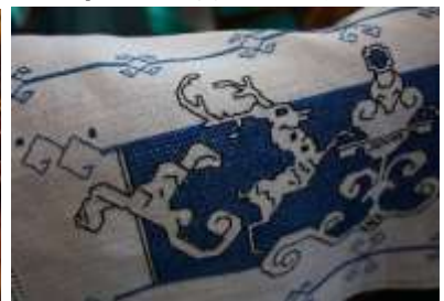
プント・アッシジ