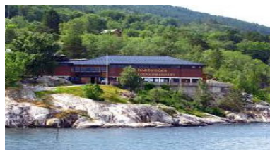
ハーダンガーフォークミュージアム