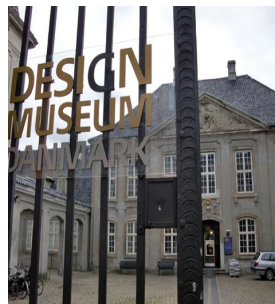
デザインミュージアム