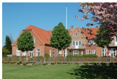
スカルス手芸学校