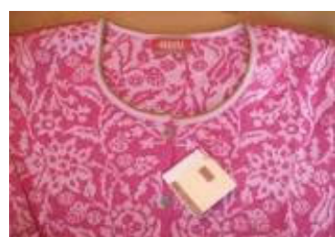
オレアナカーティガン