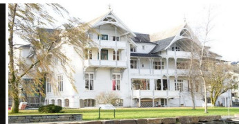
トーンホテルサンドヴェン