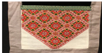
ハーダンガーフォークミュージアム展示品