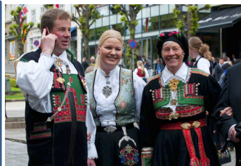
ブーナッドで着飾る年配の人々

原型はドロンワークと呼ばれる糸抜き刺繍です。織り目に沿って規則正しく刺すステッチと織り糸を抜いて刺繍糸でかがっていく技法で組み合わされたものです。仕上がりはレース編みをしたように見えます。