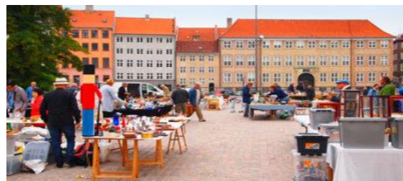
トーヴァルセン蚤の市