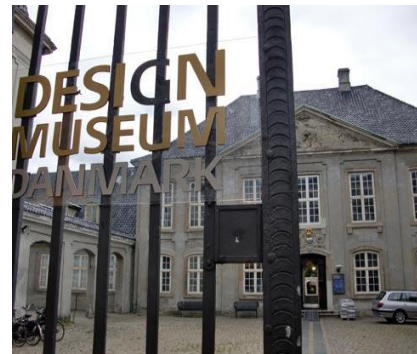
Design Museum Denmark

お問合せ・お申込み先：(株)ワールド ビジネス コミュニケーションズ (WBC)